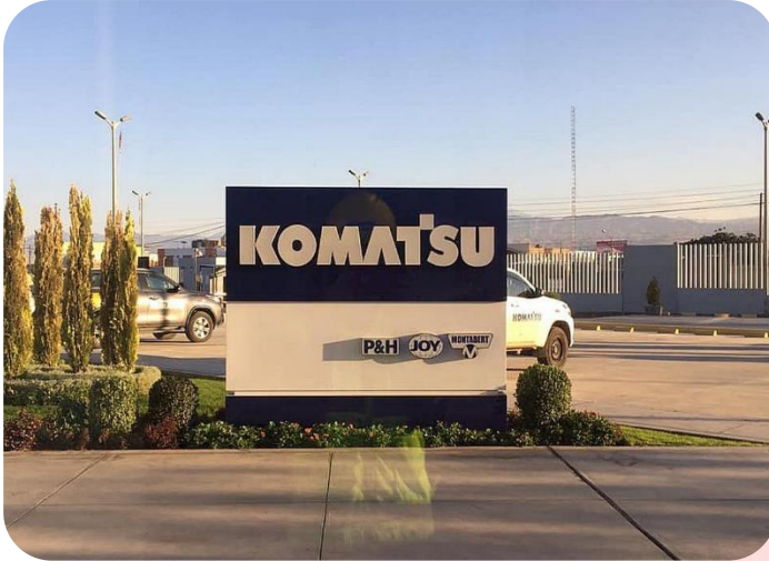
Ilustración N° 4