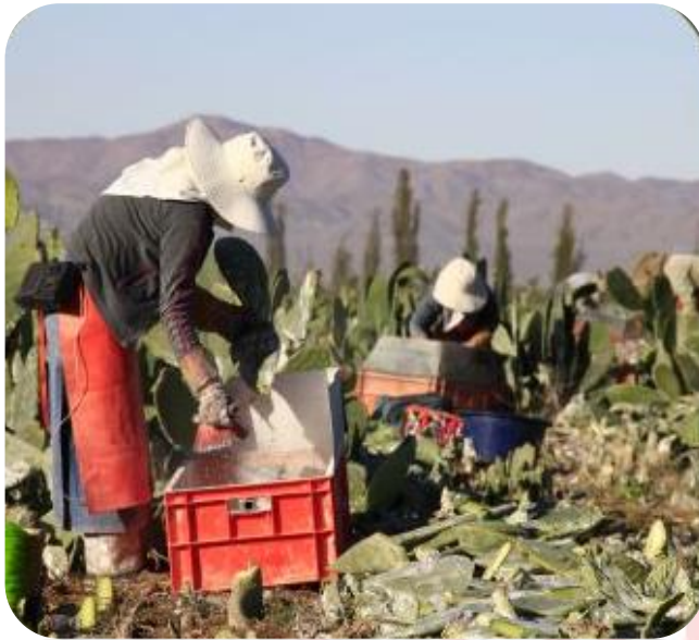
Ilustración N° 2

actividades económicas se vieron afectados siendo los más perjudicados los trabajadores independientes y los que laboran en pequeñas empresas, otro grupo de trabajadores que fueron afectados se caracterizan por presentar un mayor nivel de informalidad laboral, lo cual se asocia a una baja productividad.