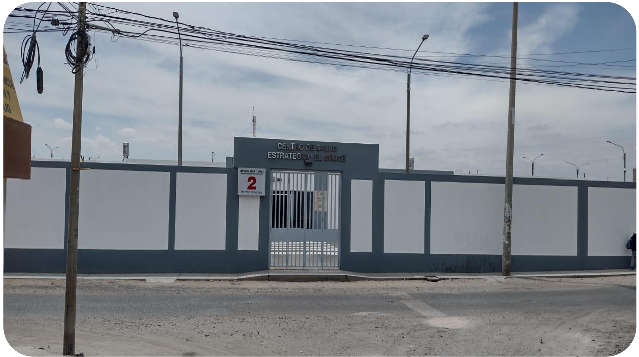
Imagen N° 10