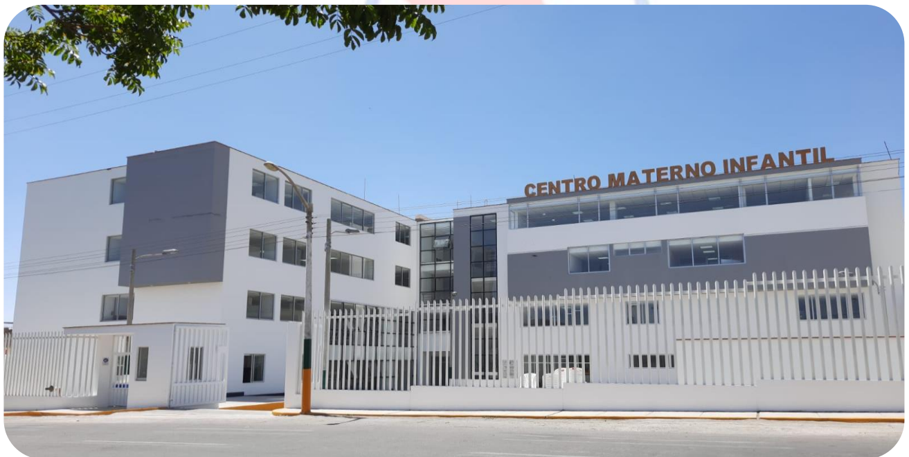
Imagen N° 7