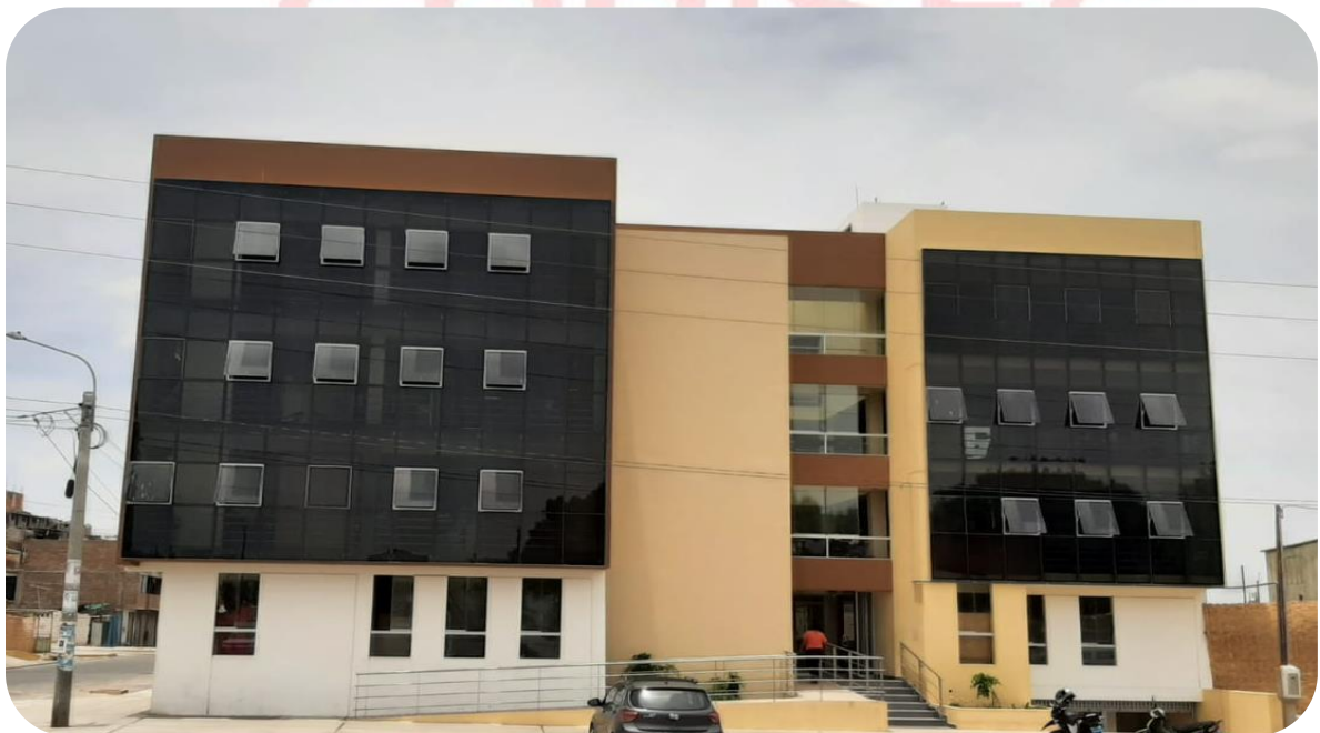
Nueva infraestructura de La Unidad de Gestión Educativa Local La Joya