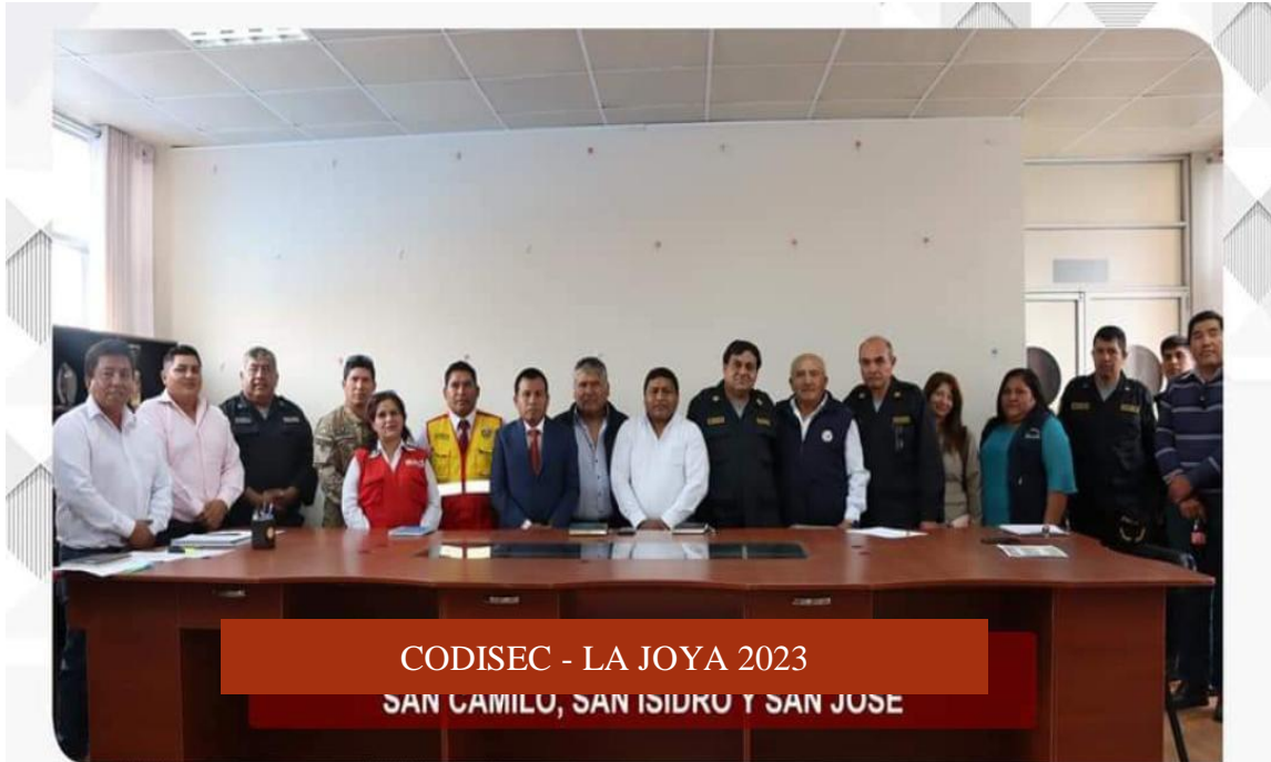
CODISEC - LA JOYA 2023 SAN CAMILO, SAN ISIDRO Y SAN JOSE