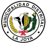
Cuadro N° 4

POBLACIÓN EN EDAD ELECTORAL DE 18 A 70 AÑOS, ESTIMADA Y PROYECTADA, AL 30 DE JUNIO, 2015 - 2022