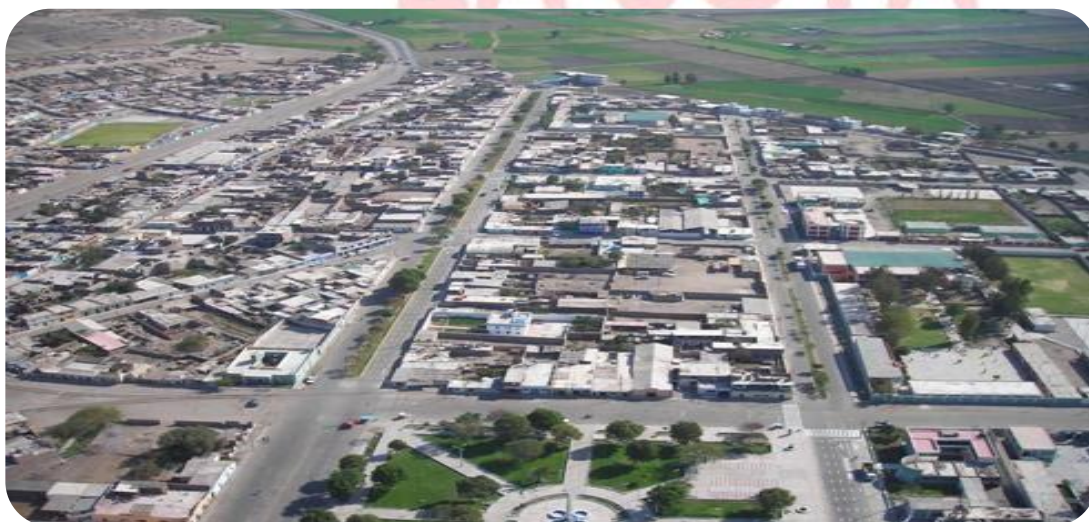
Ilustración N° 1