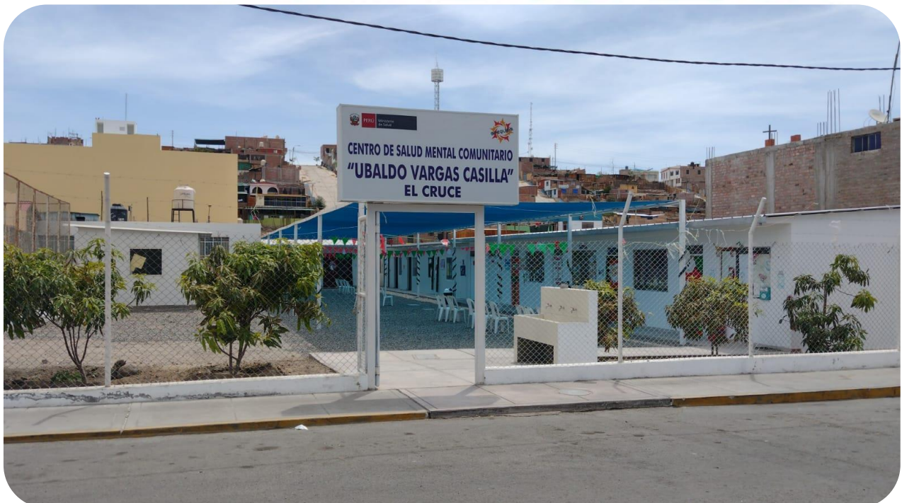
Imagen N° 9